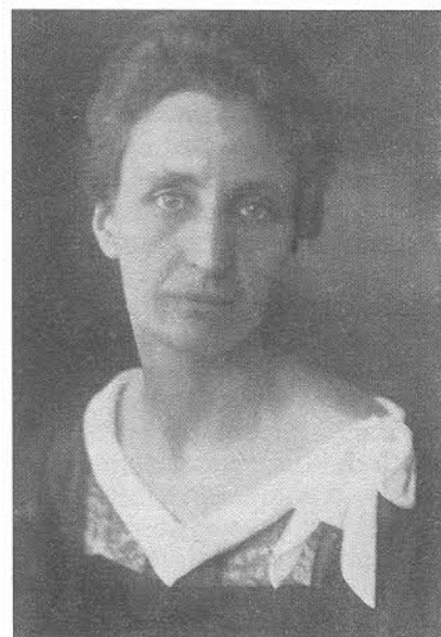
Ruth von der Leyen

„Ihre Tätigkeit in der Jugendgerichtshilfe gab ihr Veranlassung, sich mit den psychischen Anomalien der Kinder und Jugendlichen zu beschäftigen. Der Anstoß hierzu wurde dadurch gegeben, daß man sie im Jahre 1916 beauftragte, die persönliche Verbindung zwischen der Zentrale für Jugendfürsorge und der psychiatrischen Klinik der Charité, in deren Poliklinik die ärztlichen Untersuchungen für die Zentrale für Jugendfürsorge und das Jugendgericht stattfanden, herzustellen und mit den Ärzten regelmäßig Besprechungen der Einzelfälle abzuhalten. Enges Zusammenarbeiten mit dem Psychiater bei der Verfolgung der erzieherischen Ziele, unter sorgfältiger Wahrung der gegenseitigen Kompetenzen, wurde einer der maßgebenden Grundsätze ihrer Arbeit und ist es stets geblieben. In der Jugendgerichtsarbeit zeigte sich zunehmend die Bedeutung, die die abnorme psychopathische Anlage für die Entstehung jugendlicher Kriminalität hat, und die Erkenntnis setzte sich durch, daß