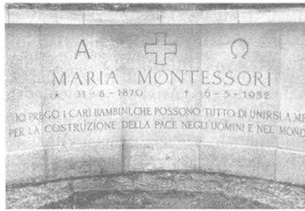
Maria Montessoris Grabstätte in Noordwijk-aan-Zee

„Ich bitte die lieben Kinder, die alles können, mit mir zusammen für den Aufbau des Friedens zwischen den Menschen und in der Welt zu arbeiten“