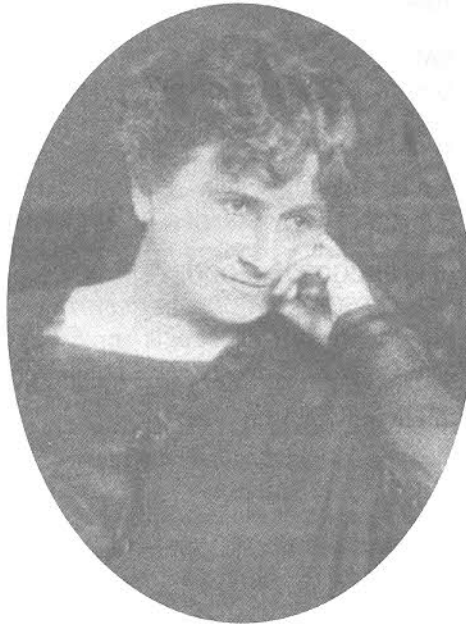
Maria Montessori (1870–1952)